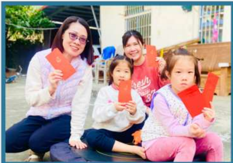
年初三弟兄姐妹們到村裏發送一元紅包祝福村民朋友們。