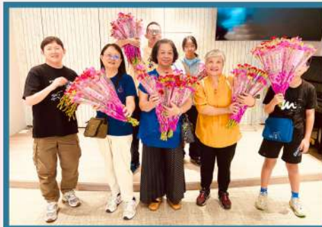
福音勇士正要到大西村以康乃馨花祝福每一個母親。