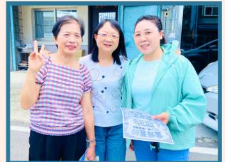
在耶穌裏我們是一家人。