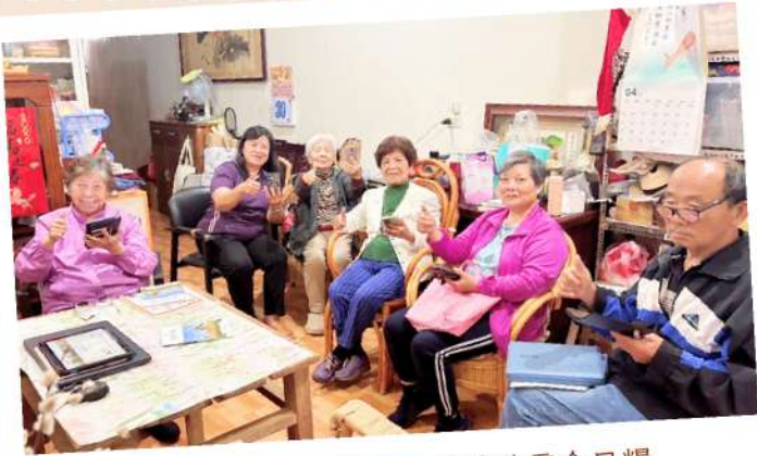
明德小組長輩學用手機聆聽靈命日糧