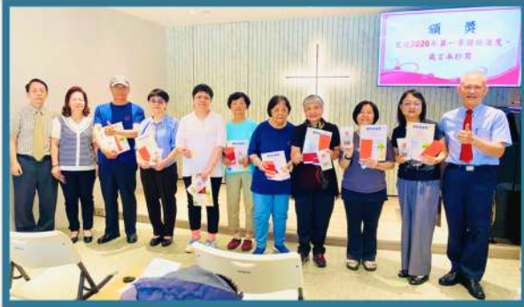
獎勵完成第一季讀經進度及抄寫箴言的弟兄姐妹們。