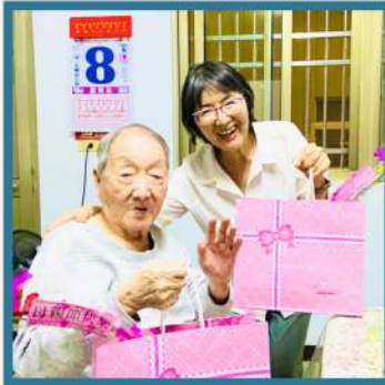
從美國回台探望父親的張姐妹。