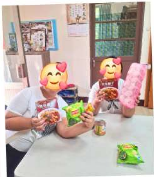
發放台灣福利會物資