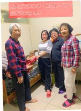
關心造橋湯弟兄一家