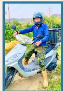
廖先生一早到菜園，樂在田園。