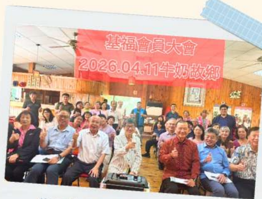
基福會員大會於造橋牛奶故鄉