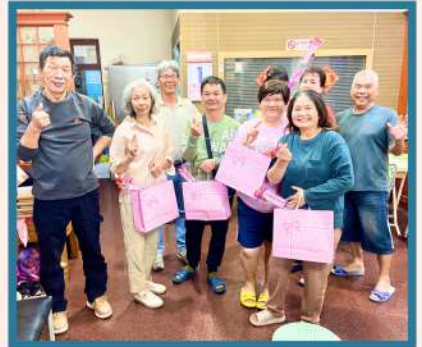
祝福母親們母親節快樂。