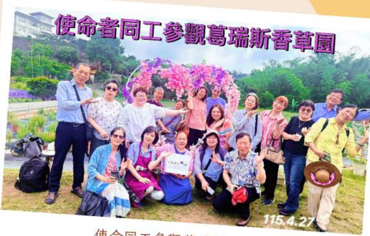
使命者同工參觀葛瑞斯香草園