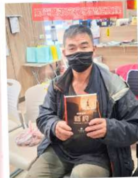
關懷葉弟兄福音分享