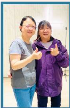
感謝美美姐妹來關心。