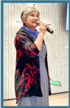
高姐妹主日分享主恩典。