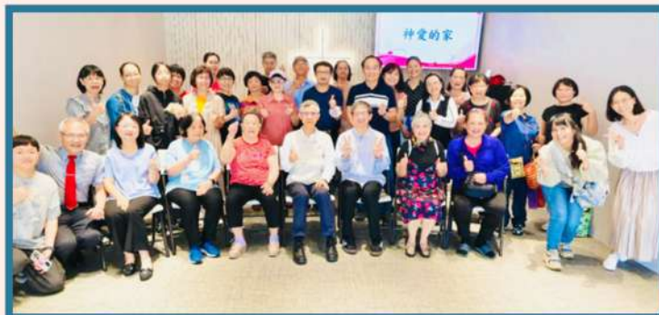
感謝新竹北門聖教會同工們來協助事工。