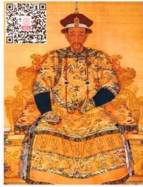
清朝康熙皇帝 親筆手書得救見證

我天淡世五口來百黃國天 願門飯間湖中時歲金需上 接受久清最大四吃三白寶實 神初為粥大為海塗萬玉正日 聖人開一充為上為去六非立月 子閑飢死和味七空若無有忠星 兒福錦白如何上穿無生命實辰 清康路衣玉何落落成無生需地 熙書全那黃金在成命實上 得聖是着幾在帝朝命寶五 永子千枉王服一命孝子谷 生通年然家衣場可最一賢金 生通年然家衣場可最一賢金